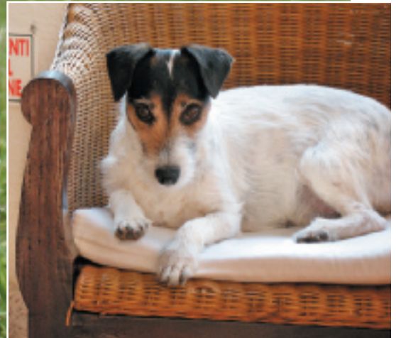
Alle sechs Monate wird Kümmels Cortisol-Status anhand eines Blutchecks kontrolliert.