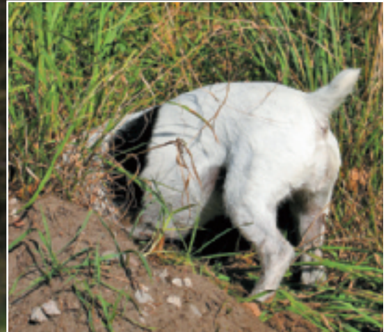
Die Mäusejagd nach Gehör machte den Alltag der blinden Jack Russell-Hündin wieder lebenswert.