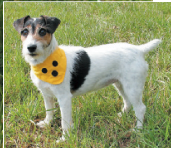
Trotz Blindheit: Kümmel hat ihren Spaß und wirkt auch mit ihrem veränderten Leben wieder rundum zufrieden.